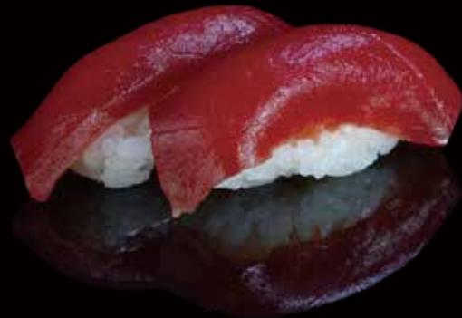
241 NIGIRI DE ATÚN 2u tuna nigiri 2p