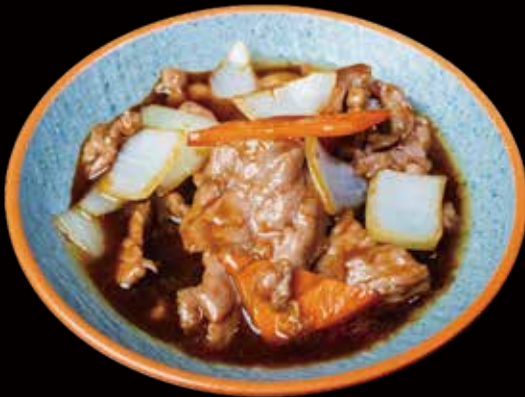
52 TERNERA CON VERDURAS beef with vegetables