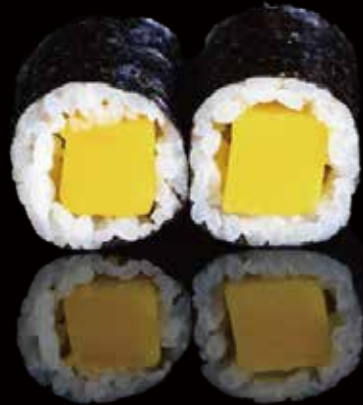
271 HOSOMAKI CON MANGO 6u mango hosomaki 6p