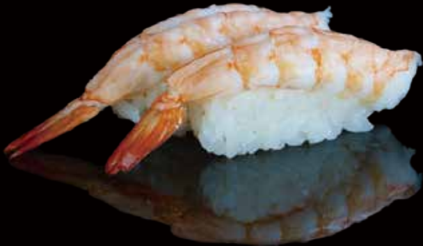
242 NIGIRI DE GAMBA 2u shrimp nigiri 2p