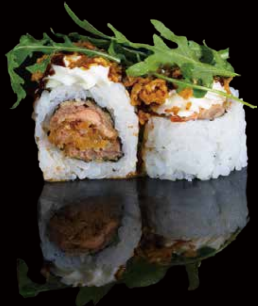
321 URA ESPECIAL CON PHILADELPHIA Y RUCULA 4u special ura roll with philadelphia and arugula 4p