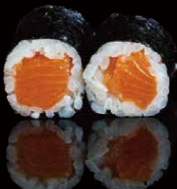
273 HOSOMAKI CON SALMÓN 6u salmon hosomaki 6p