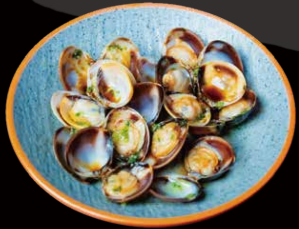
79 ALMEJAS A LA PLANCHA grilled clams