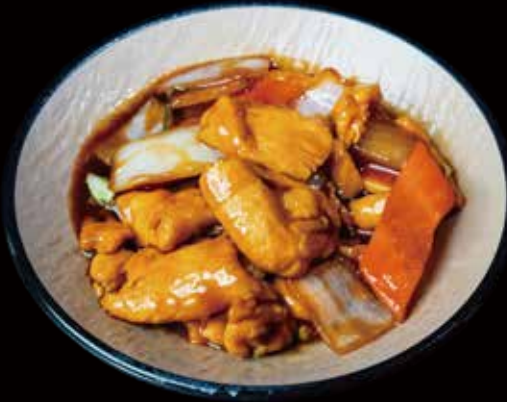
50 POLLO CON VERDURAS stir fried chicken with vegetable