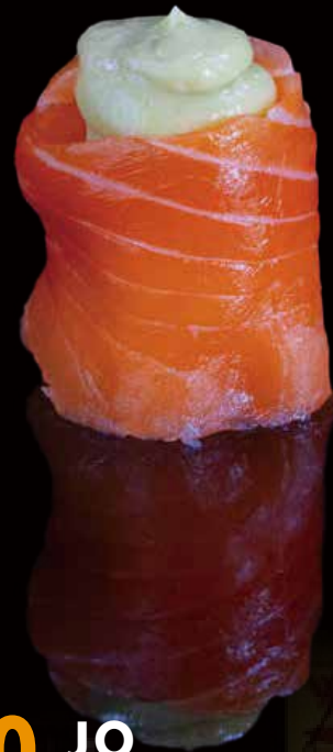
260 JO AGUACATE 1u avocado jo 1p