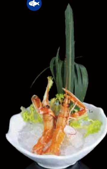
356 SASHIMI CIGALAS 2u scampi 2p 2.00€