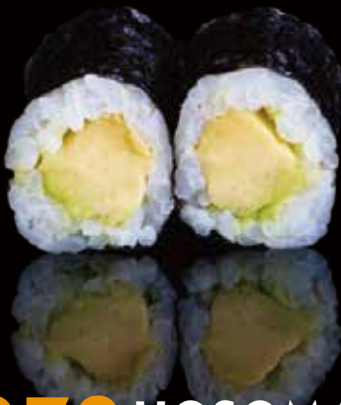
272 HOSOMAKI CON AGUACATE 6u avocado hosomaki 6p