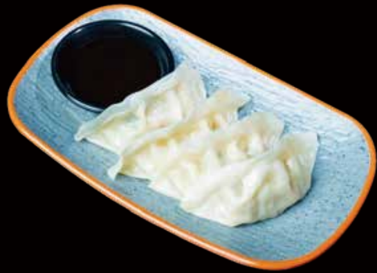
125 GYOZA DE CARNE 4U pork gyoza 4p