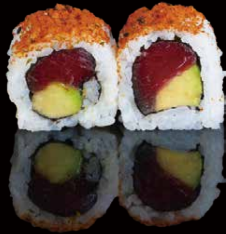
302 URA ATÚN CON AGUACATE 4u ura tuna with avocado 4p