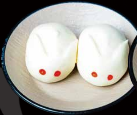
126 PANECILLOS EN FORMA DE CONEJO 2U bunny-shaped buns 2p