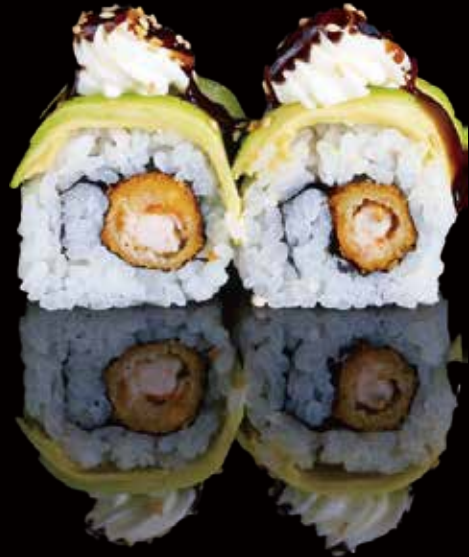
319 URA ESPECIAL DE EBITEN 4u special ura roll with ebiten 4p