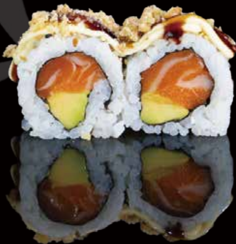
303 URA SALMÓN CON AGUACATE Y NUECES 4u ura salmon with avocado and walnuts 4p