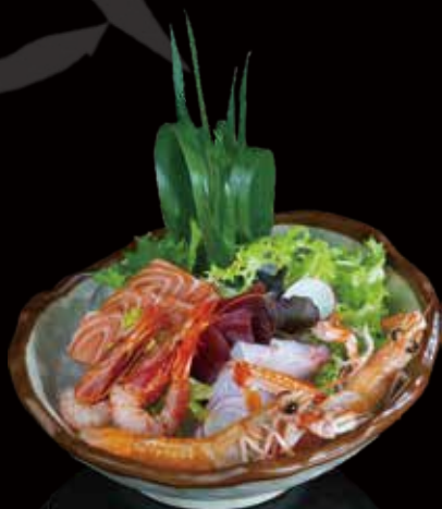
354 SASHIMI MIX 12u mixed sashimi 12p 4.00€