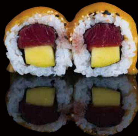
313 URA ATÚN CON MANGO 4u ura tuna with mango 4p