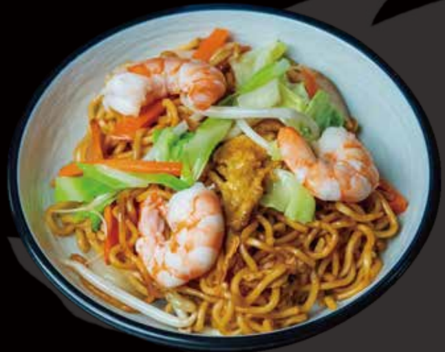
31 YAKISOBA CON POLLO yakisoba with chicken