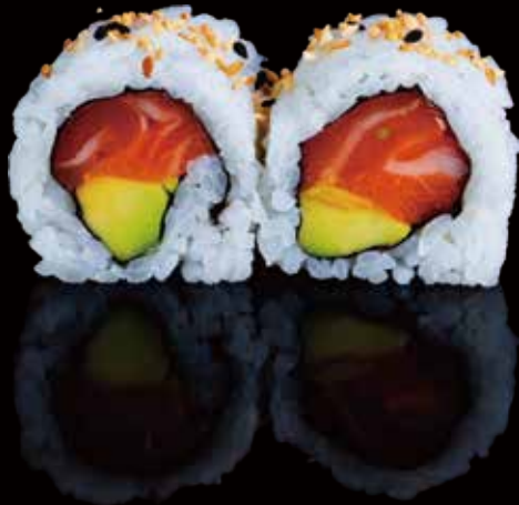
301 URA SALMÓN CON AGUACATE 4u ura salmon with avocado 4p