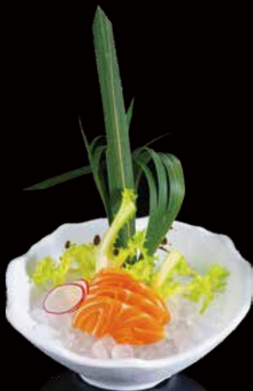
350 SASHIMI SALMÓN 3u salmon sashimi 3p