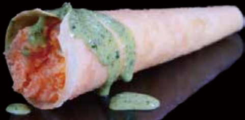
206 CONO DE SAKE 1u salmon cone 1p