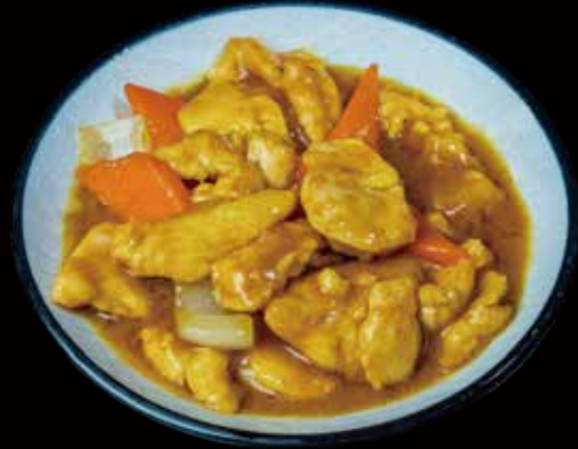
51 POLLO AL CURRY curry chicken