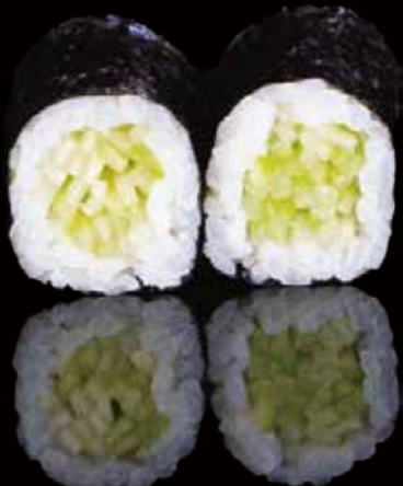
270 HOSOMAKI CON PEPINO 6u cucumber hosomaki 6p