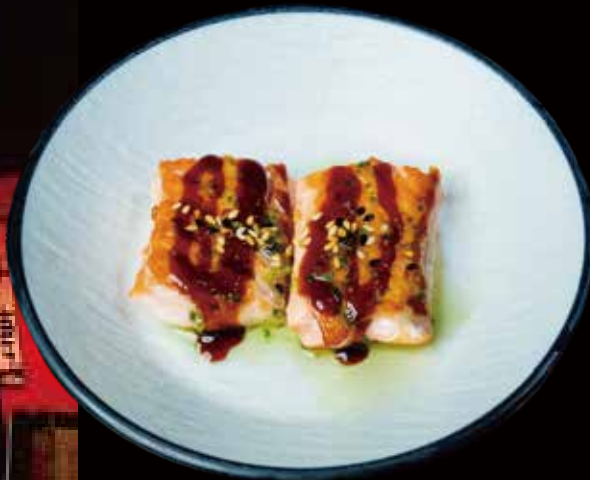
78 SALMÓN A LA PLANCHA 2U grilled salmon 2p