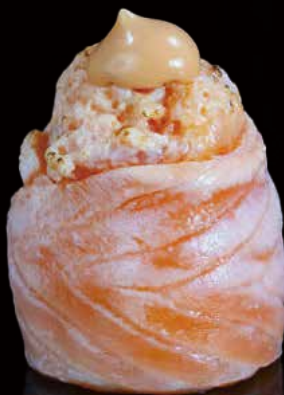
257 JO DE SALMÓN FIRE 1u salmon fire jo 1p