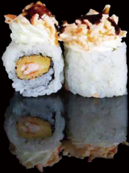
318 URA ESPECIAL DE EBITEN CON KANI 4u special ura roll with ebiten and kani 4p