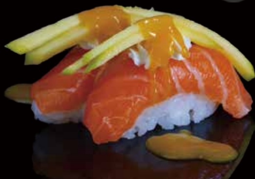
244 NIGIRI DE SALMÓN CON MANGO 2u salmon nigiri with mango 2p