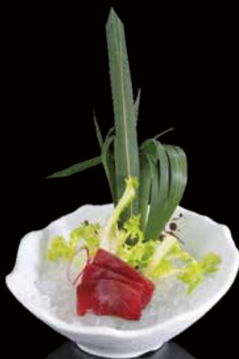
351 SASHIMI ATÚN 3u tuna sashimi 3p