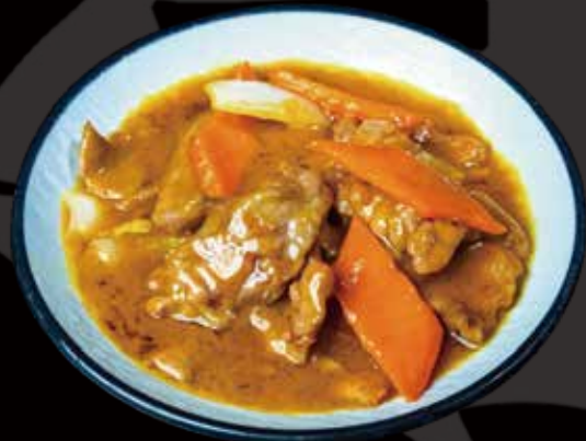
53 TERNERA AL CURRY curry beef