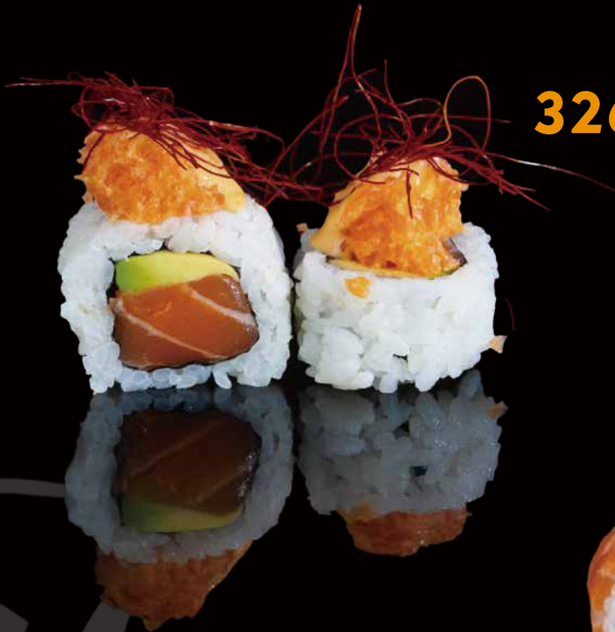
326 URA ESPECIAL TARTAR DE SALMÓN PICANTE 4u special ura roll with spicy salmon tartare 4p