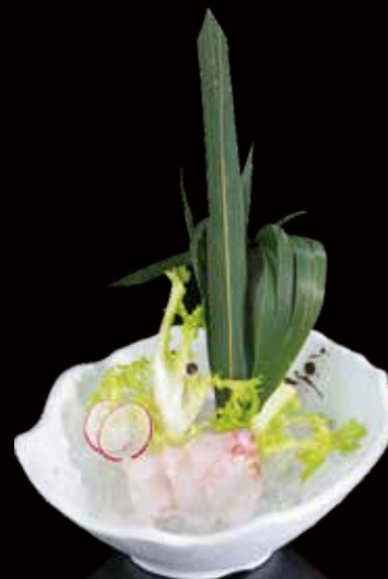
352 SASHIMI SUZUKI 3u sea bass (suzuki) sashimi 3p