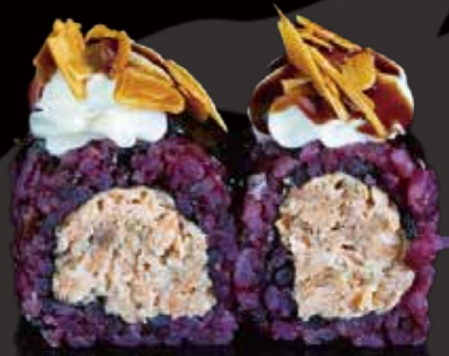
331 URA BLACK SALMÓN COCIDO 4u black cooked salmon ura 4p