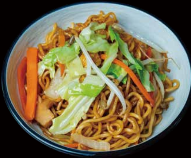
29 YAKISOBA CON VERDURAS yakisoba with vegetables