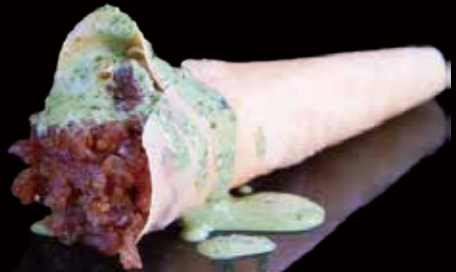
207 CONO DE ATÚN 1u tuna cone 1p