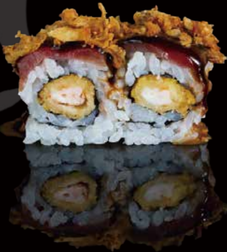
320 URA ESPECIAL CON CEBOLLA 4u special ura roll with onion 4p