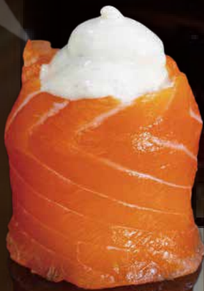
261 JO TARTUFATA 1u truffle jo 1p