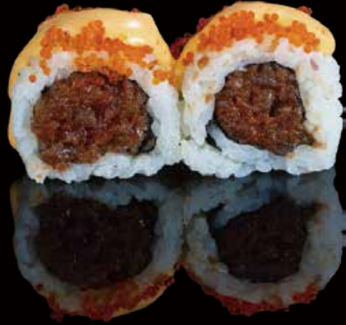
315 URA ATÚN PICANTE 4u spicy tuna ura roll 4p