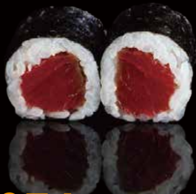
274 HOSOMAKI CON ATÚN 6u tuna hosomaki 6p