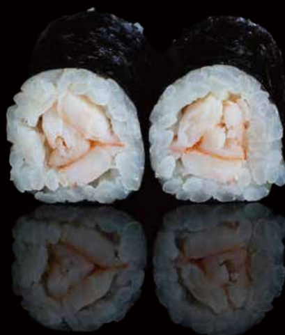
277 HOSOMAKI CON GAMBAS 6u shrimp hosomaki 6p