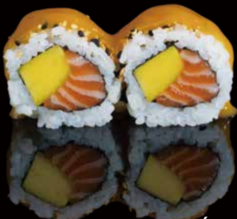
312 URA SALMÓN CON MANGO 4u ura salmon with mango 4p