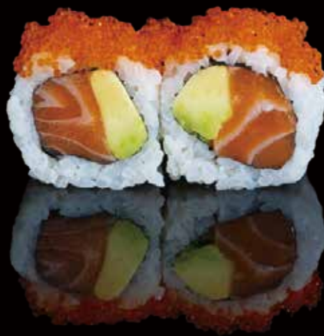
304 URA SALMÓN CON AGUACATE Y TOBIKO 4u ura salmon with avocado and tobiko 4p