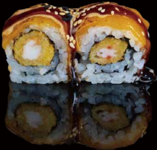
316 URA ESPECIAL DE GAMBAS CON CHEDDAR 4u special shrimp ura with cheddar 4p