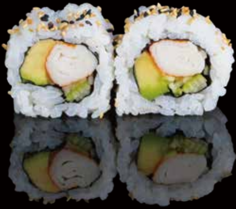
309 URA CALIFORNIA 4u california ura 4p