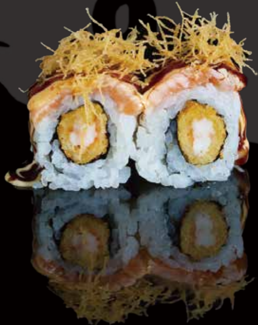
317 URA ESPECIAL DE GAMBAS CON KATAIFI 4u special shrimp ura with kataifi 4p