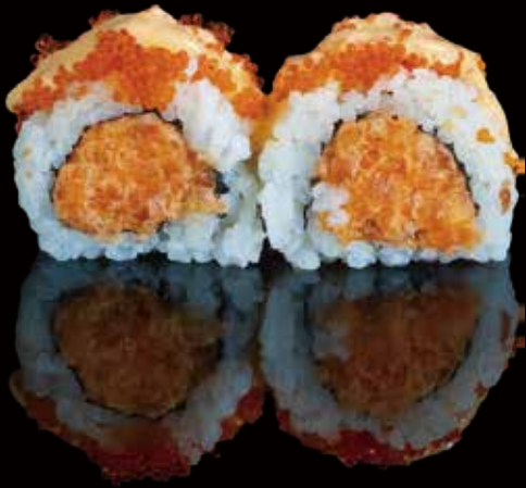
314 URA SALMÓN PICANTE 4u spicy salmon ura roll 4p