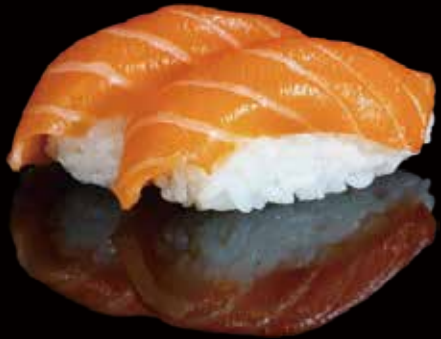
240 NIGIRI DE SALMÓN 2u salmon nigiri 2p