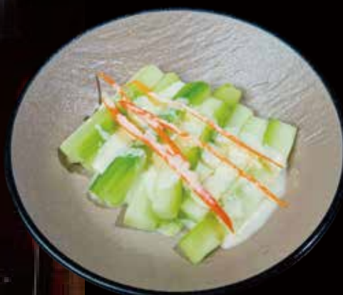
5 ENSALADA DE PEPINO cucumber salad