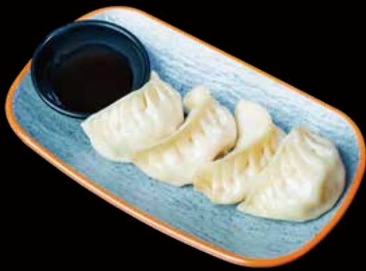
124 GYOZA VEGETAL 4U vegetable gyoza 4p