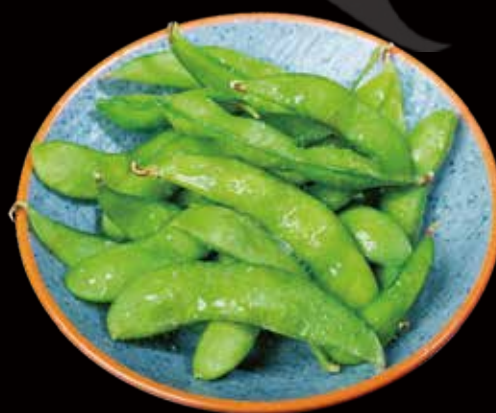
6 EDAMAME edamame