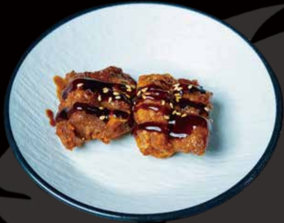
92 ALITAS DE POLLO 2U chicken wings 2p