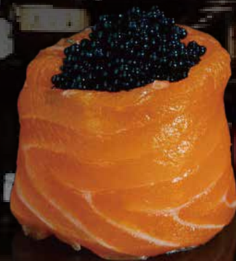
262 JO TOBIKO NEGRO 1u black tobiko jo 1p