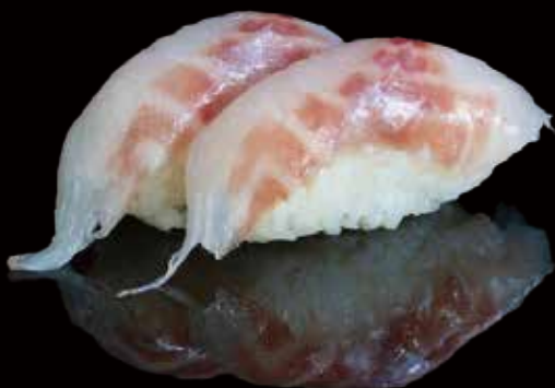
243 NIGIRI DE LUBINA 2u seabass nigiri 2p