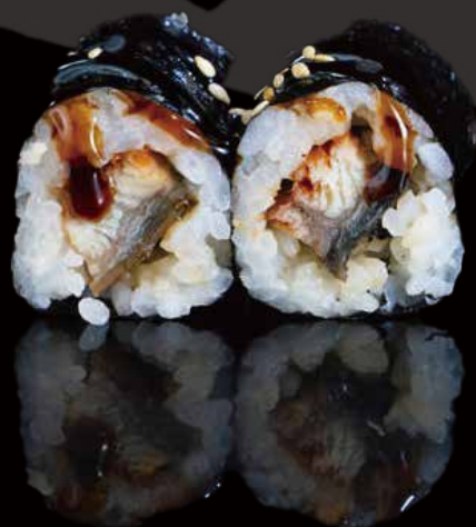
279 HOSOMAKI CON UNAGUI (ANGUILA) 6u eel hosomaki 6p