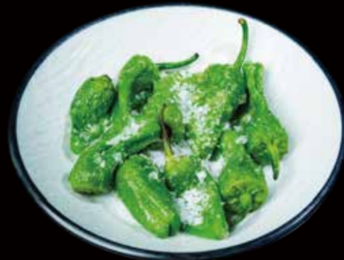
102 PIMIENTOS FRITOS fried peppers