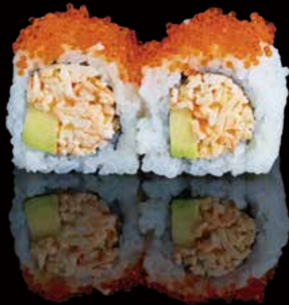
310 URA ROLL DE KANI 4u kani ura roll 4p